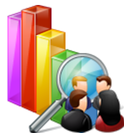
Quantitativo de visitas do Portal da Transparência