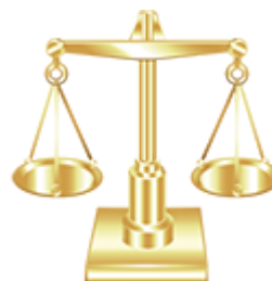
Leis, Decretos e Normativas