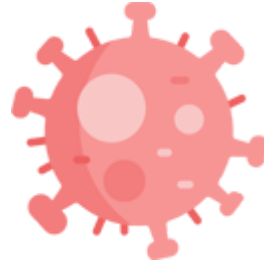
(01) Ações Covid-19 (Novo Coronavírus) Última atualização em 27/03/2023