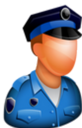
Multas de Trânsito