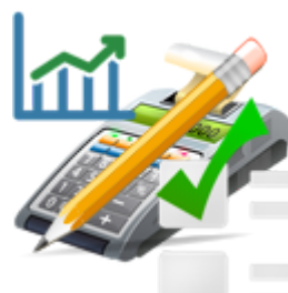
Prestação de Contas - Balanço Anual Prestação de Contas do Governo Municipal Relatório de Gestão Fiscal (RGF) Relatório Resumido da Execução Orçamentária (RREO)