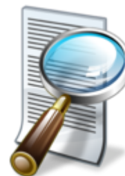
Consulta de Documentos (Protocolo)