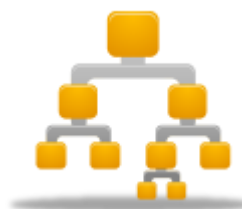
Histórico de Acesso do Usuário