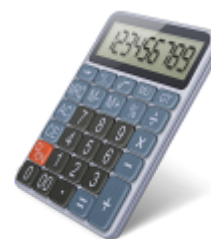
Execução Orçamentária Consolidada (2022)