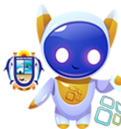
Assistente Virtual (Buziano)