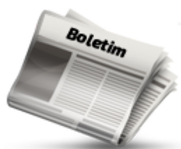
Boletim Informativo Digital