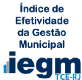
Índice de Efetividade da Gestão Municipal