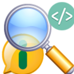
Busca de Informações e Quantitativo de Acessos