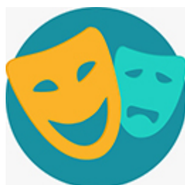
Cultura e Patrimônio Histórico