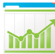
Orçamentos (LOA, LDO, PPA e QDD)