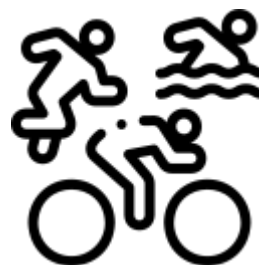
Lazer e Esporte (Termo de ajuste e ciência)