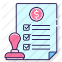
Folha de Pagamento (Salário dos Servidores)