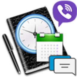
(01) Acesso as Secretarias