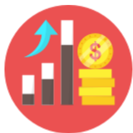
Programas, Projetos e Ações