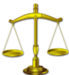
Lei 1.626 de 15 de abril de 2021. Regulamenta o Acesso à Informação Pública no Âmbito Municipal