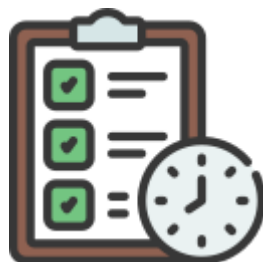
Lista de Espera de Exames e Procedimentos Cirúrgicos