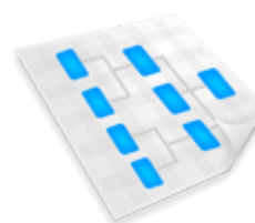
Mapa do Site