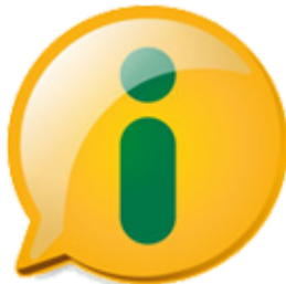
(01) e-SIC/SIC (Serviço de Informação ao Cidadão)