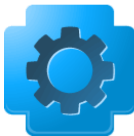
API de Dados