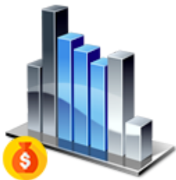
(01) Acompanhamento do Orçamento (Saldos)