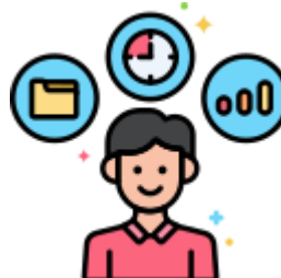
Carta de Serviço ao Usuário