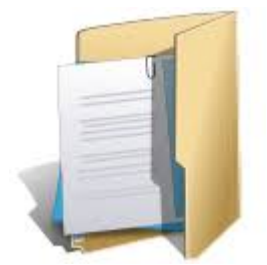
Relatórios de Audiência Pública