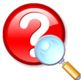
Perguntas e Respostas