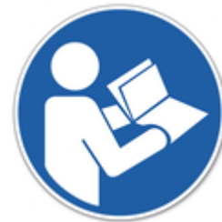
(01) Manuais ensinando a utilizar o e-Sic