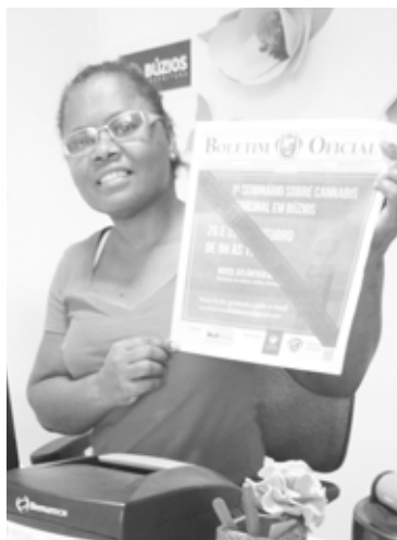
Wagna - UBS Olavo da Costa - Rasa.