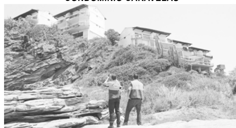
Os flats foram desocupados até que uma empresa habilitada faça escoramento para execução das obras

Uma operação realizada na manhã desta quinta-feira (17) pela Defesa Civil de Búzios resultou na interdição preventiva de todos os flats construídos no costão rochoso em um condomínio no bairro Caravelas, que faz parte da APA do Pau Brasil.