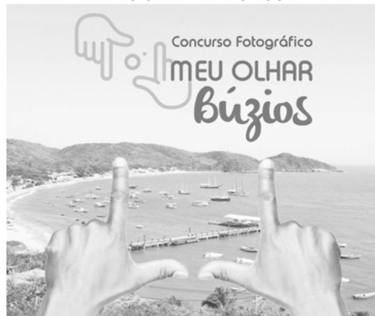
Veja aqui tudo que você precisa saber sobre o Concurso de Fotografias

O Município de Armação dos Búzios, através da Secretaria Municipal de Cultura e Turismo, por meio deste regulamento, torna pública a abertura das inscrições para Concurso de Fotografias "Meu Olhar de Búzios 2019".