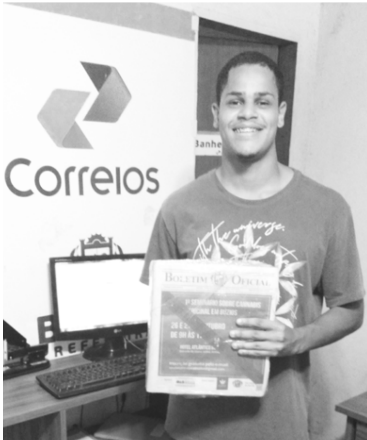
Wallison - Agência dos Correios - Grande Rasa