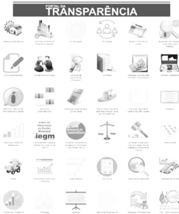
Assuntos de interesse da população com fácil acesso.

O Portal da Transparência já se encontra completo, atualizado e em funcionamento no site oficial da prefeitura.